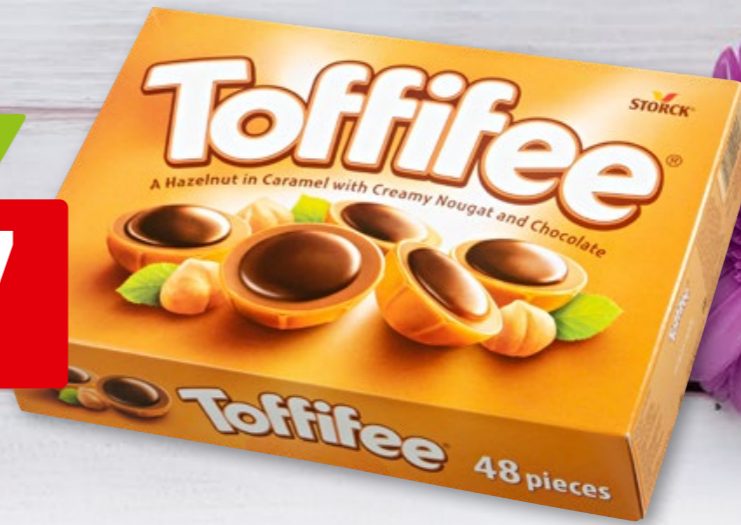
Storck Toffifee 48 Stück