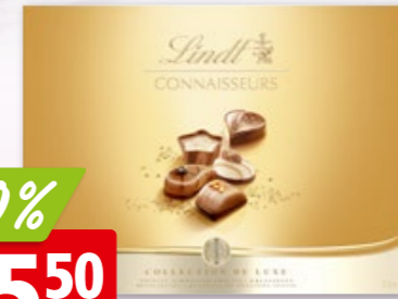
Lindt Connaisseurs de Luxe