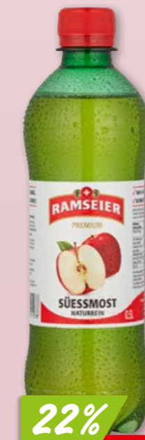
Ramseier Schorle 24 x